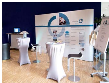
Unser Codiplan Stand